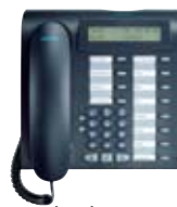
optiPoint 500 standard