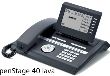
OpenStage 40 lava

Die OpenStage-Produktfamilie ermöglicht innovative Anwenderlösungen durch intuitiv gestaltete Funktionalität und Bedienbarkeit. Die Geräte sind offen für den Zugang zu verschiedenen Diensten und Anwendungen durch Interoperabilität mit anderen Geräten.